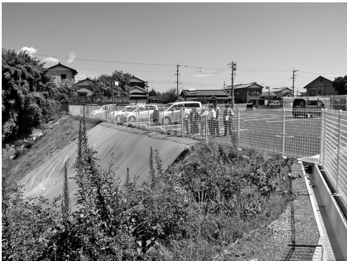
「大方中央保育所・のり面崩落場所」視察

❖既に建て替えが決まっている三浦小学校は、現在の敷地内で改築を行うことに決まりました。そのため安定した場所を探すためのボーリングを行う等の、地質調査及び地盤対策設計委託費1321万円の補正予算が組まれました。