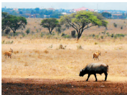
ナイロビナショナルパーク

ケニアはアフリカ大陸の東側に位置し、国の真ん中辺りに赤道が通っていて、海岸側や北部・北東部はとても暑いです。首都のナイロビ周辺は標高が1600mほどあり、比較的過ごしやすい気候です。多民族国家で、公用語として英語・スワヒリ語を使用しています。ケニアには16の主要な動物生態系があり、国立公園、国立保護区、動物保護区として国や地方自治体が管理しています。動物が身近に感じられる、本当に素敵な場所です☆